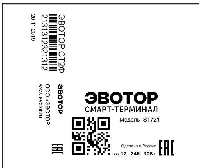
Рисунок 3. Пример маркировочных шильдов