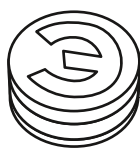
Рисунок 1. Изображение пломбы